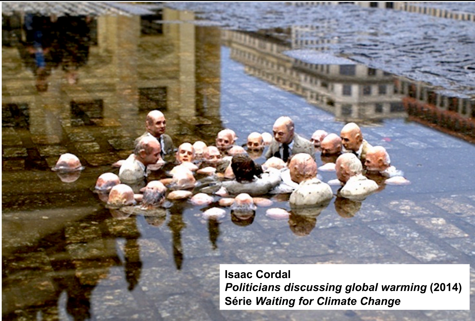
Isaac Cordal Politicians discussing global warming (2014) Série Waiting for Climate Change